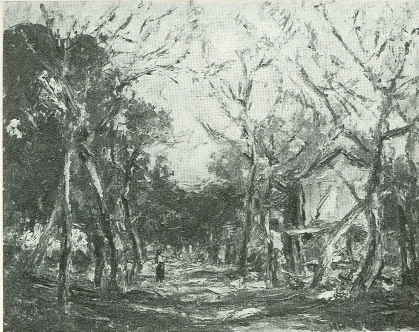
18. CALLECITA EN LA COSTA DEL PLATA (San Isidro)