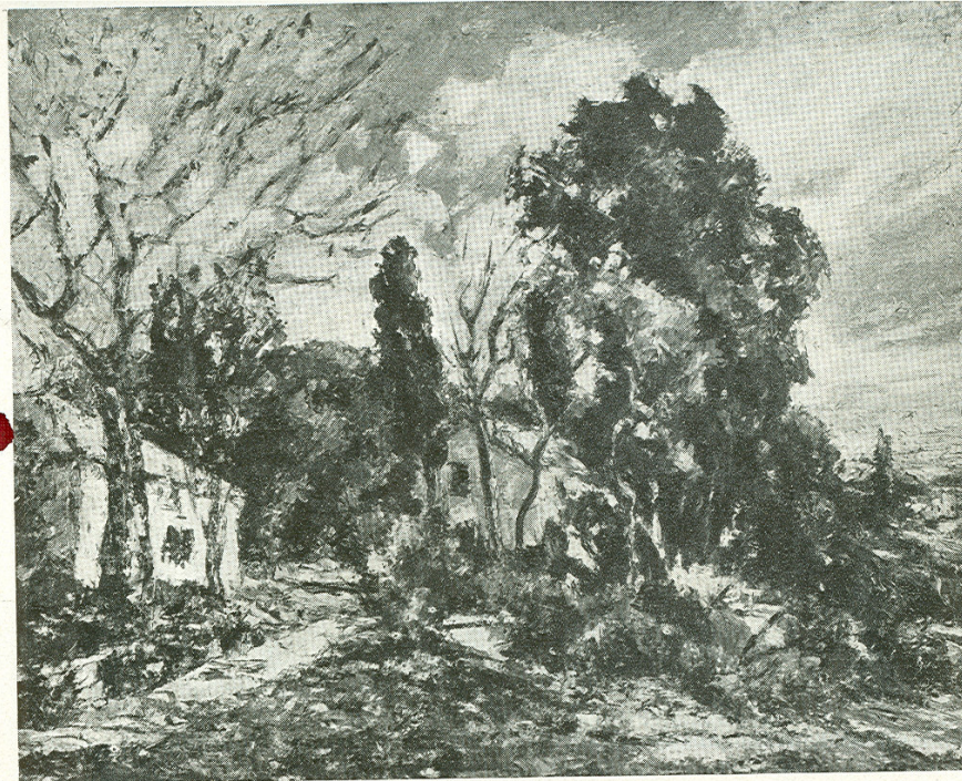
9. PAISAJE EN LAS QUINTAS (San Isidro)