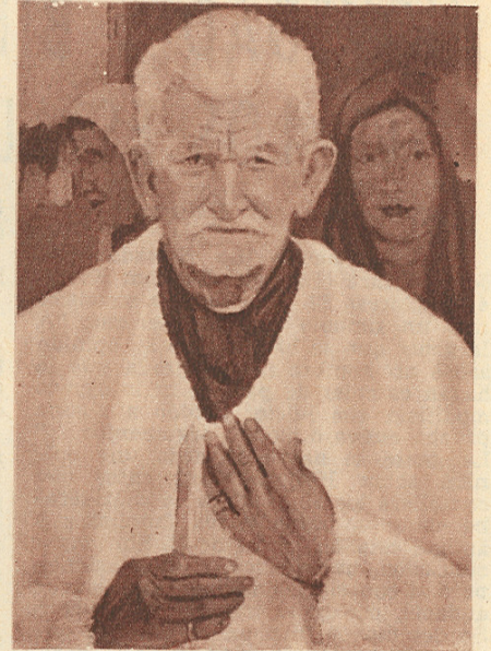
"EL PROMESERO". Óleo, 1951