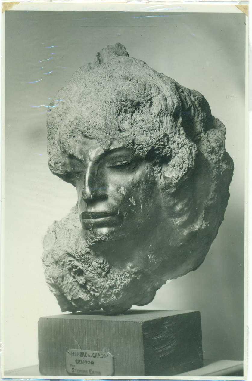
HOMBRE DEL CHACO QUEBRACHO Por STEPHEN EASTON