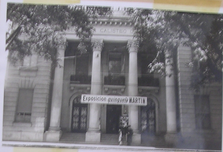
Frente del Edificio del Museo Provincial "Rosa Galistero de Rodríguez" - Santa Fe 26/7/50