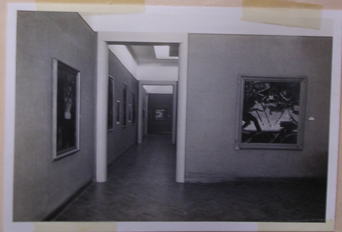
"Sala con Temas de Fuego" Museo "Rosa Galisteo de Rodríguez" Santa Fe' 26/7/10