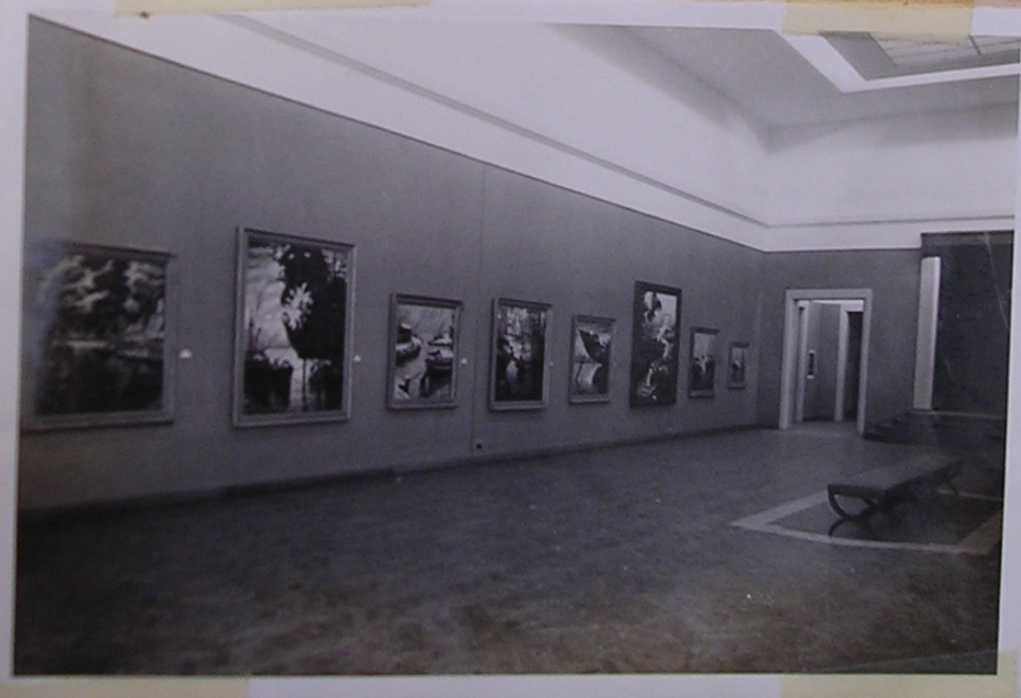
"Sala Principal" Museo Provincial "Rosa Galisteo de Rodríguez" Santa Fe