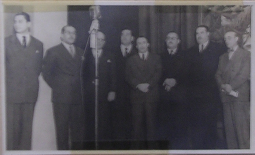
Autoridades cantando el Himno Nacional el día de la Inauguración de la Exposición en Santa Fe 26 de Julio de 1950