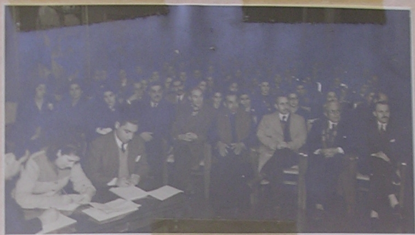
Otro sector del Museo en que se ve el público que concurrió a escuchar a Quiñiguala en la Conferencia Oral que dió en el Museo.