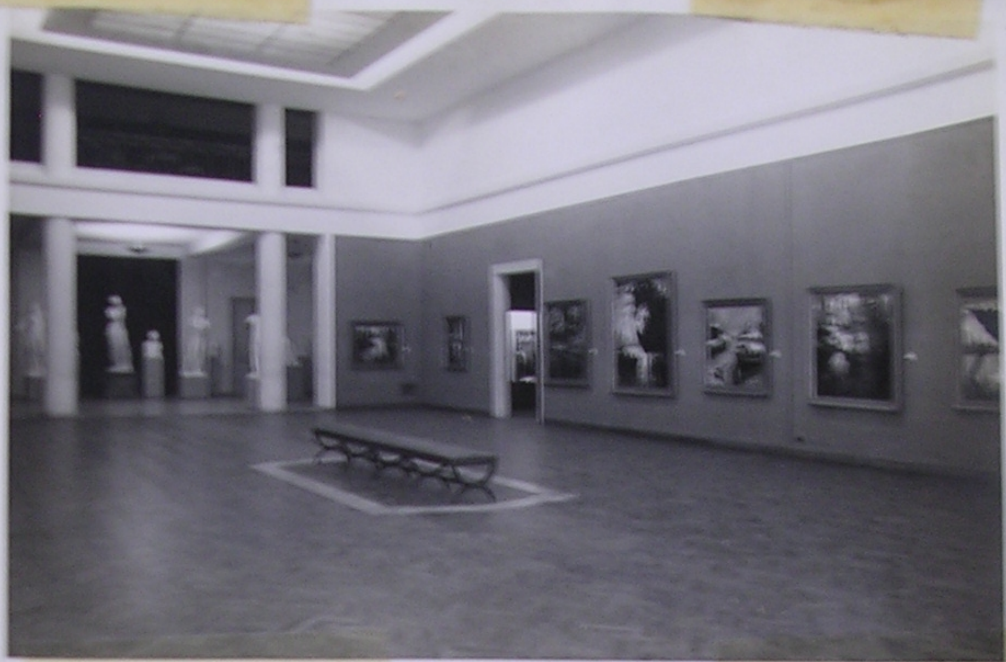
Gran salón del Museo Provincial "Pasa Galister de Rodríguez" Santa Fe 26/7/50