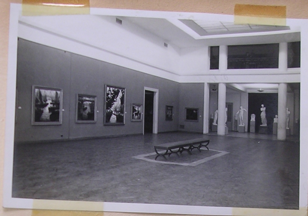
Sala Mayor del Museo "Rosa Galisteo de Rodríguez" (al fondo parte del Museo de Calles) 26/X/50 Santa Fe