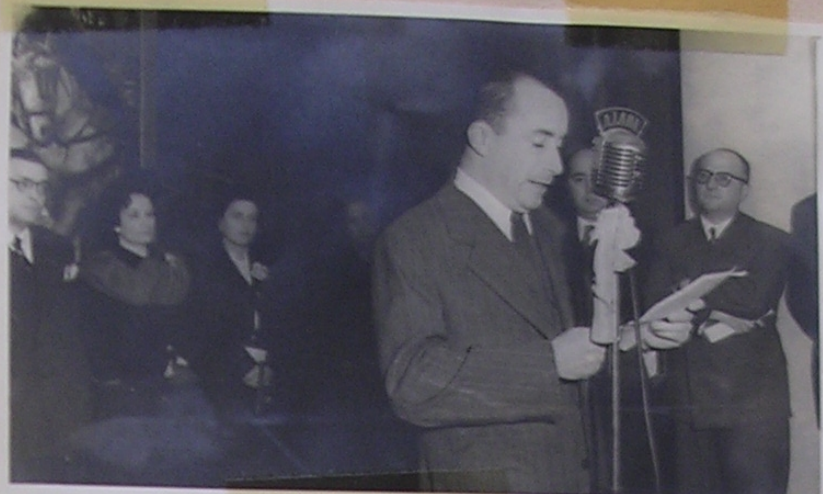
El Ministro de Justicia y Educación. Dr. Raul H. Rapela, pronunciando un discurso en el día de la inauguración 26/7/50