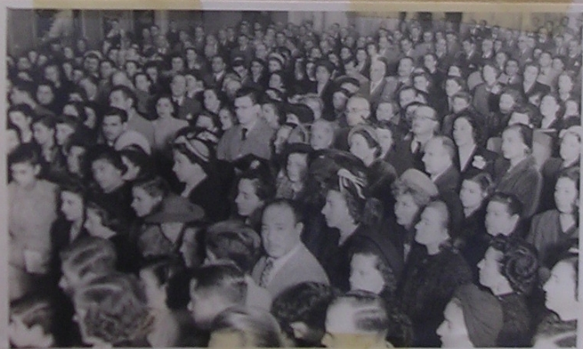
Público que asistió a la inauguración en Santa Fe. 26/7/50