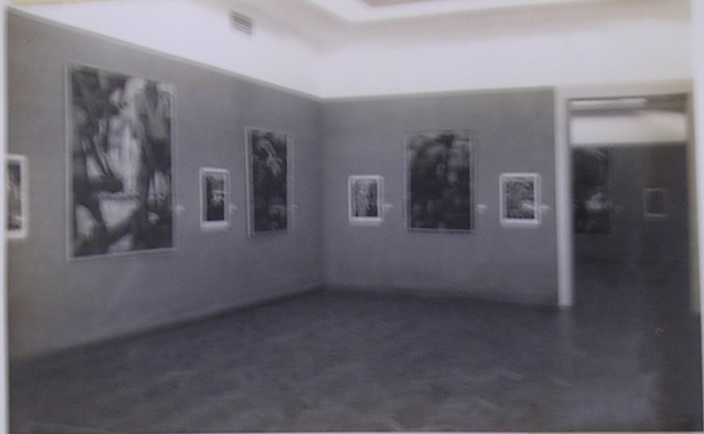
"Sala de Dibujos" Museo Provincial "Ana Galisteo de Rodríguez" Santa Fe 20/4/10