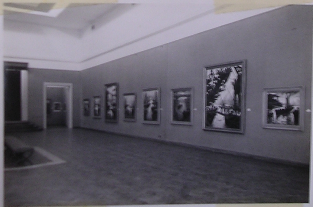
Sala Principal del Museo "Pasa Galister de Rodríguez" Santa Fe 26/7/50