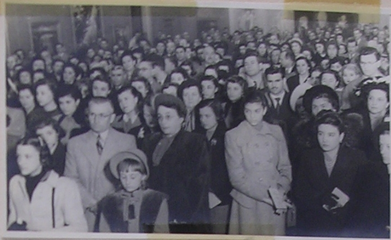
Público que concurrió a la inauguración de la Exposición de Quinquela en Santa Fe 26/7/50