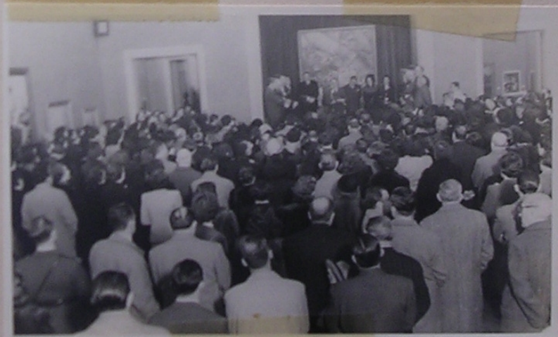
Inauguración de la Exposición de Quinquela en Santa Fe. 26/7/50