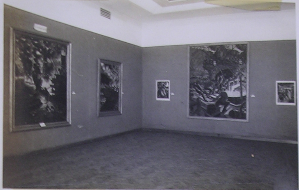
Sala I del Museo "Rosa Galisteo de Rodríguez" Santa Fe' 26/7/10