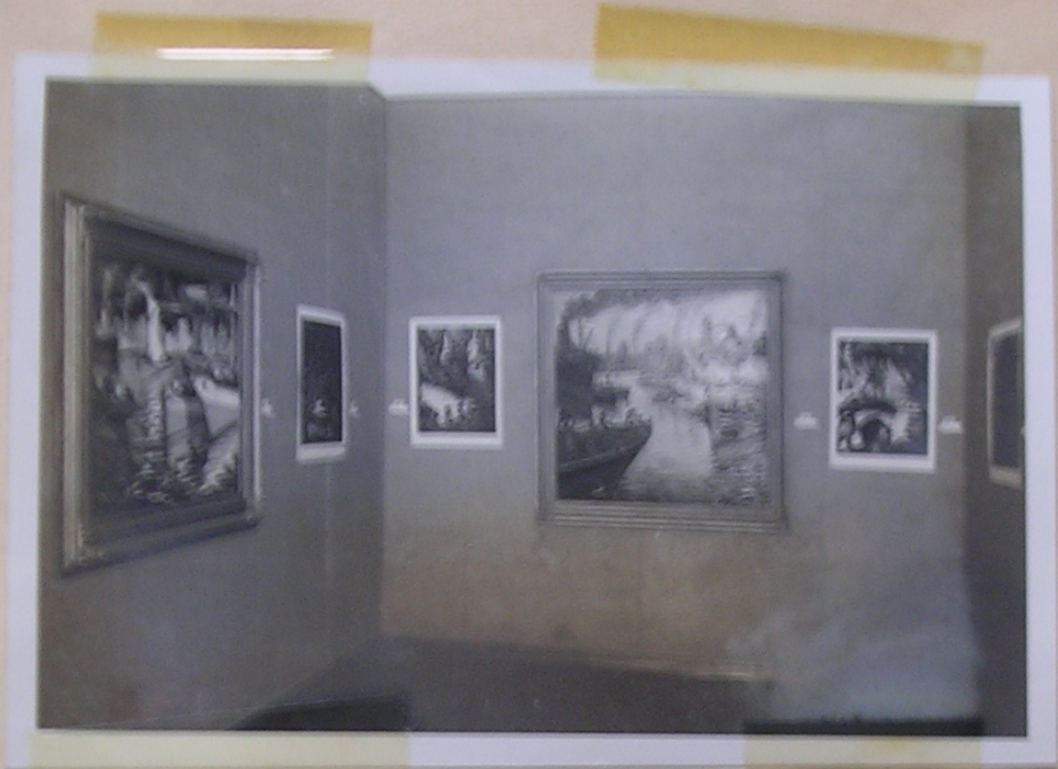
Rincon del Salon N o III. del Museo "Rosa Galarte de Rodriguez". 26/7/10