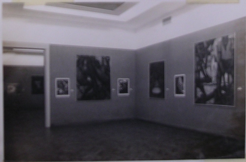
"Vista de la Sala de Dibujos" Museo Provincial "Ana Galisteo de Rodríguez" Santa Fe 20/4/10